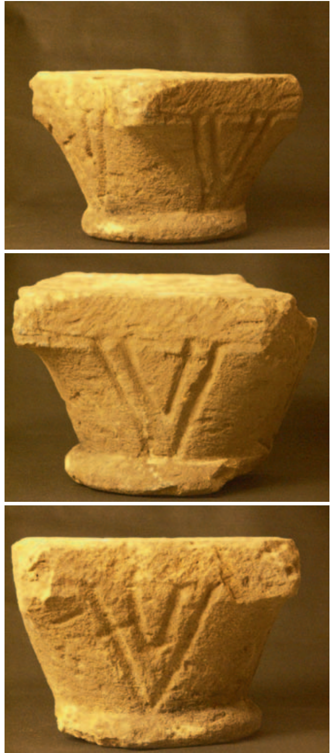
Afb. 2a-c. Kapiteel uit Vrouwenklooster

Met het problematische jaartal 1113 eindigen de onduidelijkheden niet, want ook andere bronnen spreken elkaar tegen. De veertiende-eeuwse kroniekschrijver Johannis de Beke meldt dat Oostbroek in 1121 werd gesticht. 9 In Arnoldus Buchelius' verzamelhandschrift dat tegenwoordig bekend staat als de Monumenta 10 en dat zich in het Utrechts Archief bevindt, wordt de stichtingsdatum van zowel Vrouwenklooster als Oostbroek op 1125 gesteld, nadat twee ridders in 1122 al een begin hadden gemaakt. In zijn abtenlijst noemt Buchelius abt Ludolfus echter als eerste kloosteroverste met als aanvangsjaar 1113. Van Heussen, die in 1719 schreef, beweert dat bisschop Godebald van Utrecht in 1121 financieel bijdroeg aan de bouw van een nieuw stenen kloostercomplex op de Nieuwehof en ervoor zorgde dat de nonnen een grotere zelfstandigheid kregen. 11 Daarom zou hij als de