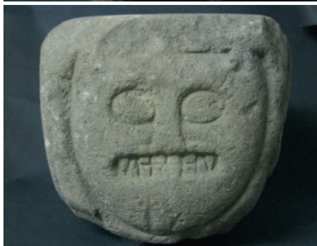
Afb. 4a, b. Details van het kapiteel met monsterkopjes

twee rijen tanden. In de hoeken zijn, zoals bij een kattengebit, twee gemene punttanden, daartussen is bovenaan een rij van vier vierkante tanden te zien. Onderaan zien we, waar de steen niet te erg verweerd of beschadigd is, steeds een uitgestoken tong tussen twee tanden. De koppen zijn niet steeds hetzelfde; twee kattenkoppen zijn langgerekt, twee zijn kleiner en breder. Duidelijk is dat deze dieren geen lieverdjes zijn. Uitpuilende ogen, een grijns vol tanden en uitgestoken tong zijn de kenmerken bij uitsteking van duivels en demonen, zoals goed te zien is op een kapiteel uit het noordtransept van de kerk te Conques, waarop een groep duivels een giergaard aan het sarren is (afb. 5).