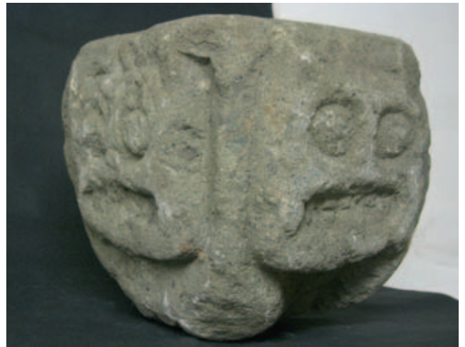
Afb. 3a-c. Kapiteel met monsterkopjes