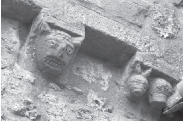
Afb. 5. Dakconsole van de kerk van St. Michael in Cunnor, Berkshire

bij kapitelen. Op sluitstenen komt een dergelijk motief vaker voor, zoals op een exemplaar uit de abdij van Keynsham van circa 1170-1180. 34 Maar het gros van dit soort koppen komt, in de enkelvoudige variant, voor in reeksen in en op het kerkgebouw: op de consoles onder de dakranden van de kerk en op torens, in het interieur bij het ontspringen van de gewelven, langs de zijwanden en in triforia. Deze reeksen zijn doorgaans heel gevarieerd, waarbij de monsterlijk grijnzende katachtigen slechts één van de vele motieven vormen.