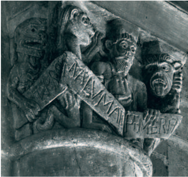
Afb. 6. Kapiteel in de noordelijke transeptarm van de Ste. Foy in Conques

Wat bedenkelijker is, kwaadafweer, amuletten en dergelijke hoorden, getuige de kerkelijke geschriften, tot het bijgeloof, de magie. Magie en bijgeloof waren zaken die de kerk niet tolereerde en streng veroordeelde. Het werd gezien als afkeer van het ware geloof. 41 Is het dan geloofwaardig dat de kerken in West-Europa datgene op hun muren lieten beeldhouwen wat men volgens de kerkelijke geschriften nu juist met man en macht probeerde uit te bannen?