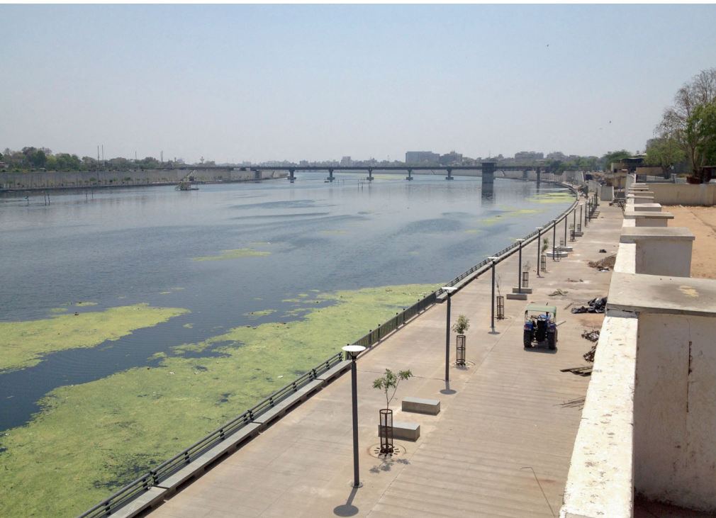
Het boulevard project langs de Sabarnati rivier, gezien vanaf de Gandhi Ashram, 2015 The boulevard project along the Sabarnati river, seen from the Gandhi Ashram, 2015