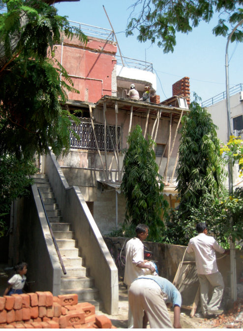
Balkrishna Doshi, woningbouw- project voor de Life Insurance Corporation, 1973-1976. Uitbrei- ding bovenwoning door middel van zelfbouw, Ahmedabad, 2013

Balkrishna Doshi, housing project for the Life Insurance Corporation, 1973-1976. Expansion by residents of the upper apartments, Ahmedabad, 2013