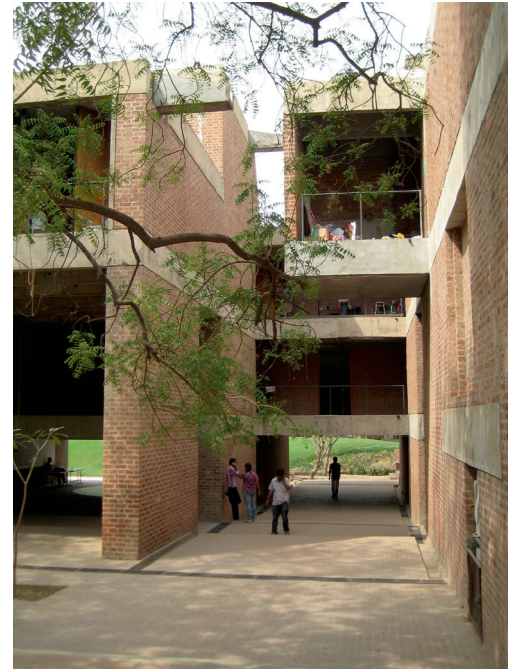
Balkrishna Doshi, toegang tot de architectuurschool op de CEPT University campus, Ahmedabad, eerste fase 1966-1968