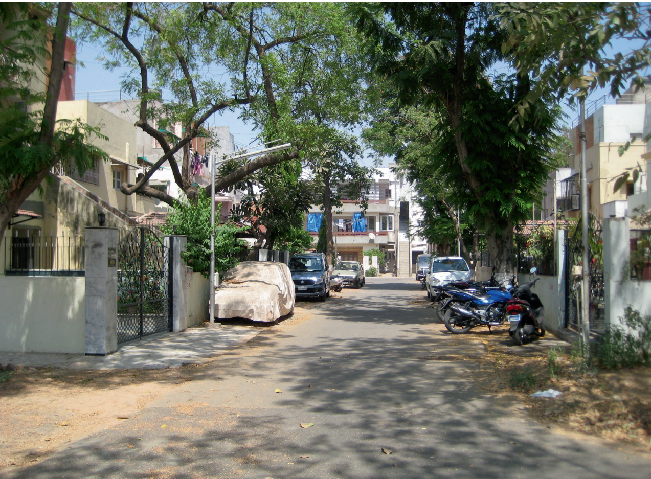
Balkrishna Doshi, woningbouw- project voor de Life Insurance Corporation, 1973-1976. Fragment met delen van originele opzet nog zichtbaar, Ahmedabad, 2013

Balkrishna Doshi, housing project for the Life Insurance Corporation, 1973-1976. Fragment with parts of the original structure still visible, Ahmedabad, 2013