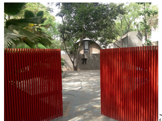
Poort naar Sangath, Ahmedabad, 1979-1981 Gate to Sangath, Ahmedabad, 1979-1981