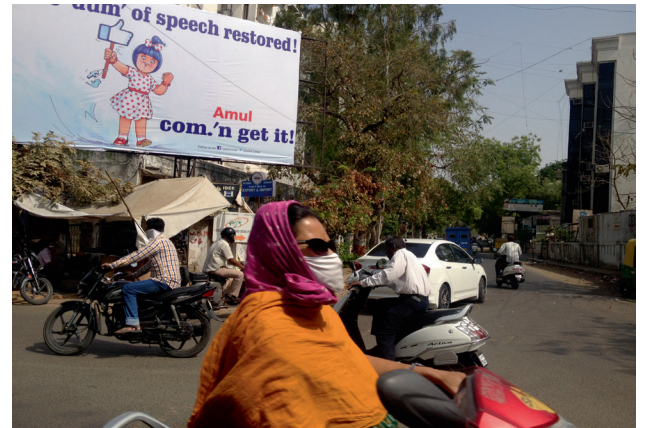
Straatbeelden Ahmedabad, 2014 Street images Ahmedabad, 2014