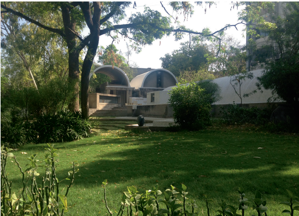
Sangath, bureau van Doshi, Ahmedabad, 1979-1981 Sangath, Doshi's office, Ahmedabad, 1979-1981

Balkrishna Doshi, entrance to the architecture school on the CEPT University campus, Ahmedabad, first phase 1966-1968