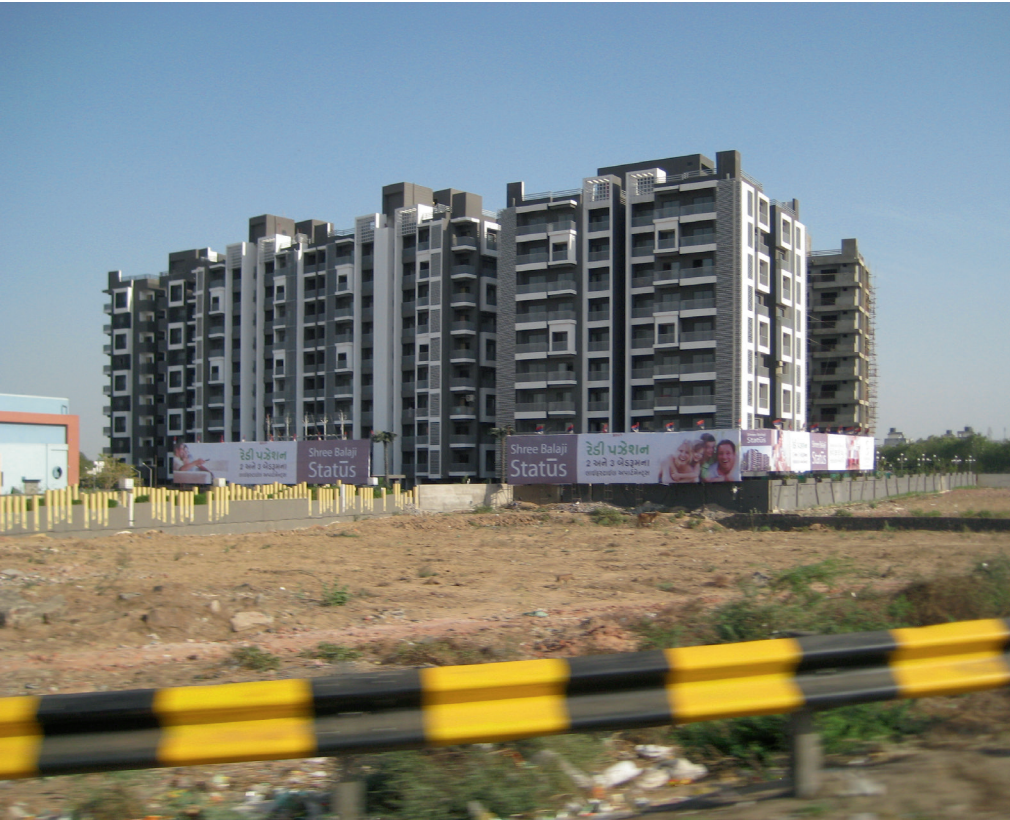
Typische nieuwbouwwontwikkeling buiten Ahmedabad, 2013 Typical new building development outside of Ahmedabad, 2013