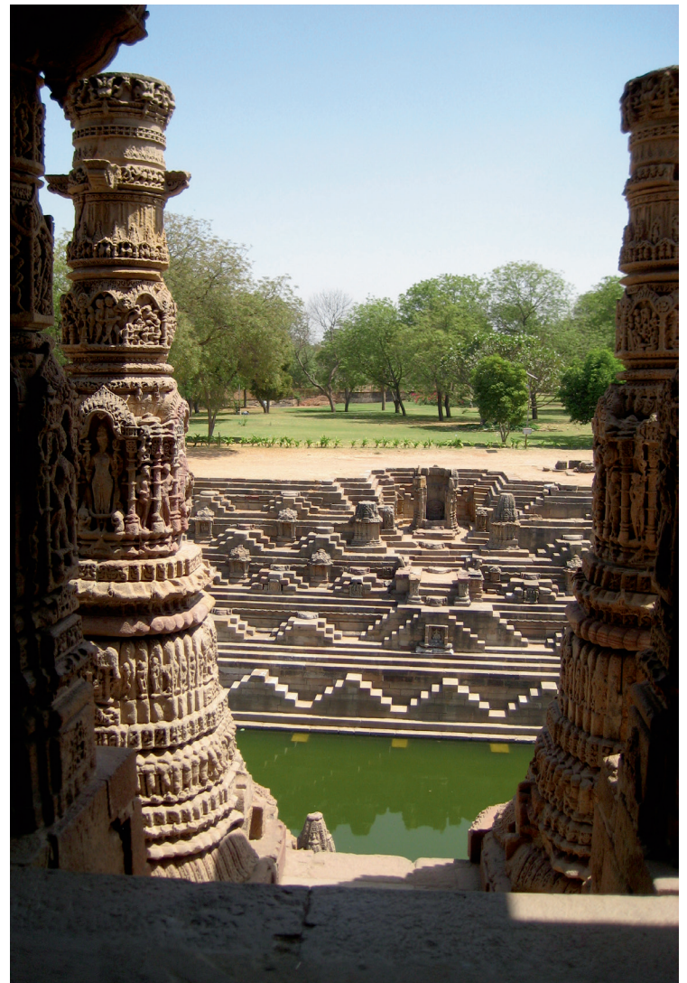
Zonnetempel uit de elfde eeuw, zicht op het waterbassin, Modhera Eleventh-century Sun Temple, a view of the water basin, Modhera

in Venetië, waarbij studenten en docenten uit verschillende landen en culturen bij elkaar worden gebracht. Denk aan het onderwijs van Bakema die onvermoeibaar de wereld over reisde met zijn multimedia-lezingen en eigenlijk altijd dezelfde opgave had, namelijk die van de stad, zoals op de Internationale Sommerakademie in Salzburg waar hij vele jaren een studio verzorgde. Het Berlage-instituut, opgericht door Hertzberger en tegenwoordig onderdeel van de TU Delft als een advanced-masters-opleiding, volgt ook deze opzet. Een ander voorbeeld is Giancarlo De Carlo's ILAUD, het International Laboratory of Architecture and Urban Design, dat De Carlo in 1976 oprichtte en dat gedurende 30 jaar het Team 10 discours voortzette. Peter Smithson, Aldo van Eyck en Herman Hertzberger waren er te gast, net als Doshi in 1987 en 1991. Dergelijke onderwijsvormen zijn bij uitstek een plek van kruisbestuiving. Ze vallen doorgaans buiten de curricula van architectuurscholen en zijn speciale momenten die reflectie en speculatie mogelijk maken, juist omdat ze daarbuiten vallen. Ze vormen in de woorden van Doshi een pauzemoment in de academische discipline. Precies daarom bieden ze de mogelijkheid van grensoverschrijding, vernieuwing en verrijking.