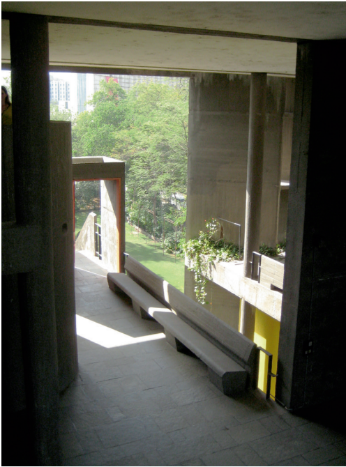
Le Corbusier, ATMA House, Mill Owners Association Building, open entreehal, Ahmedabad, 1951-1955

Le Corbusier, ATMA House, Mill Owners Association Building, open entrance hall, Ahmedabad, 1951-1955