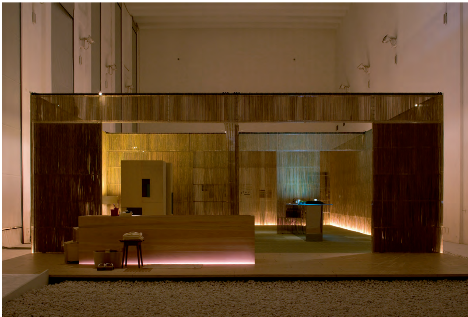
Tsunago, Salone del Mobile, Milaan, 2007 Tsunago, Salone del Mobile, Milan, 2007

Tentoonstelling/Exhibition : 18-23 april/April 2007