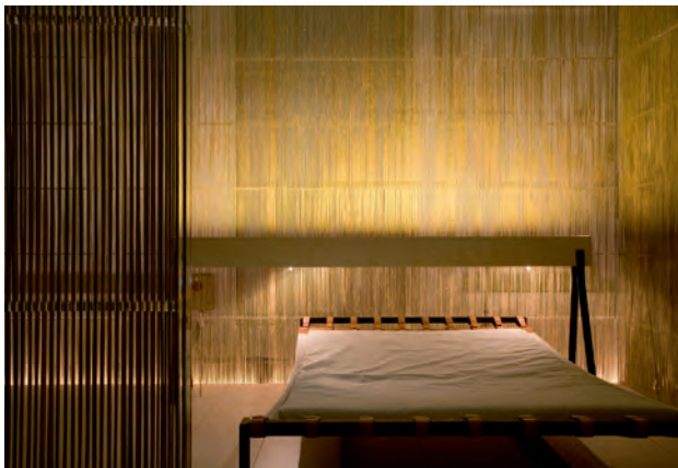
Slaapruimte Sleeping space