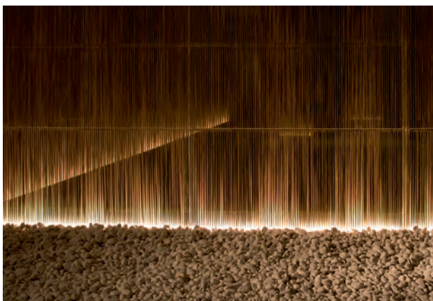
Entree ruimte detail Entrance area, detail