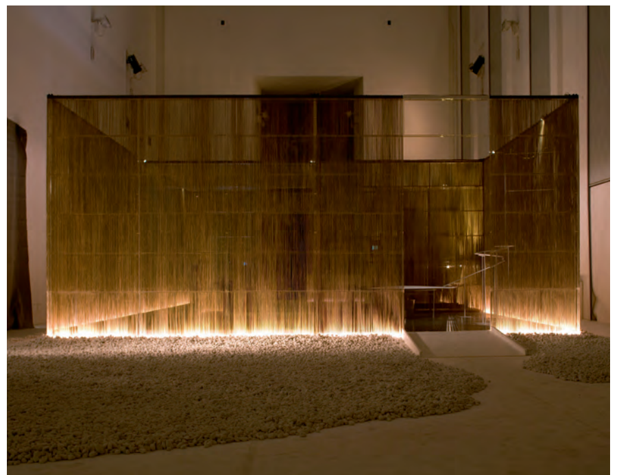
Entree ruimte Entrance area