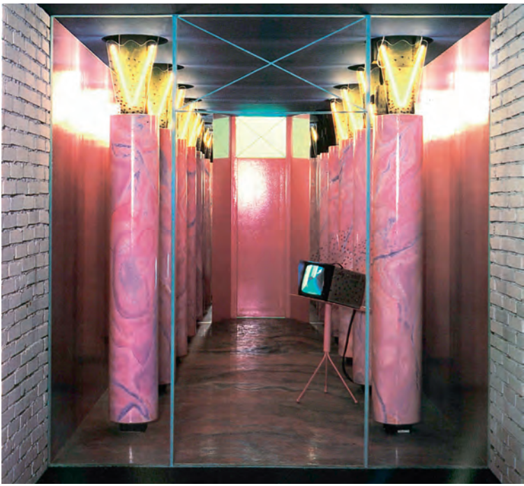
Entree met videofoon Entrance with video intercom