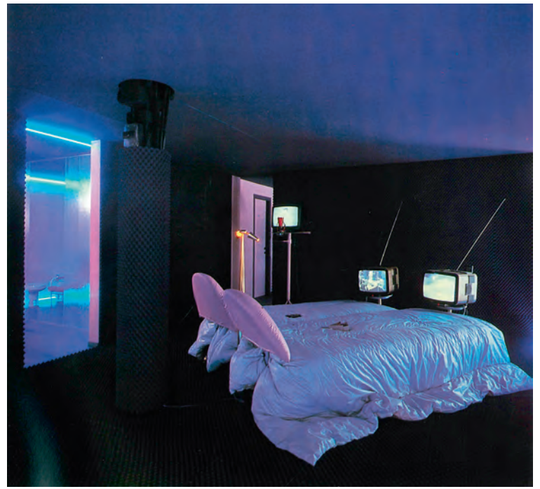
Tweepersoonsbed 'Jap' Double bed 'Jap'