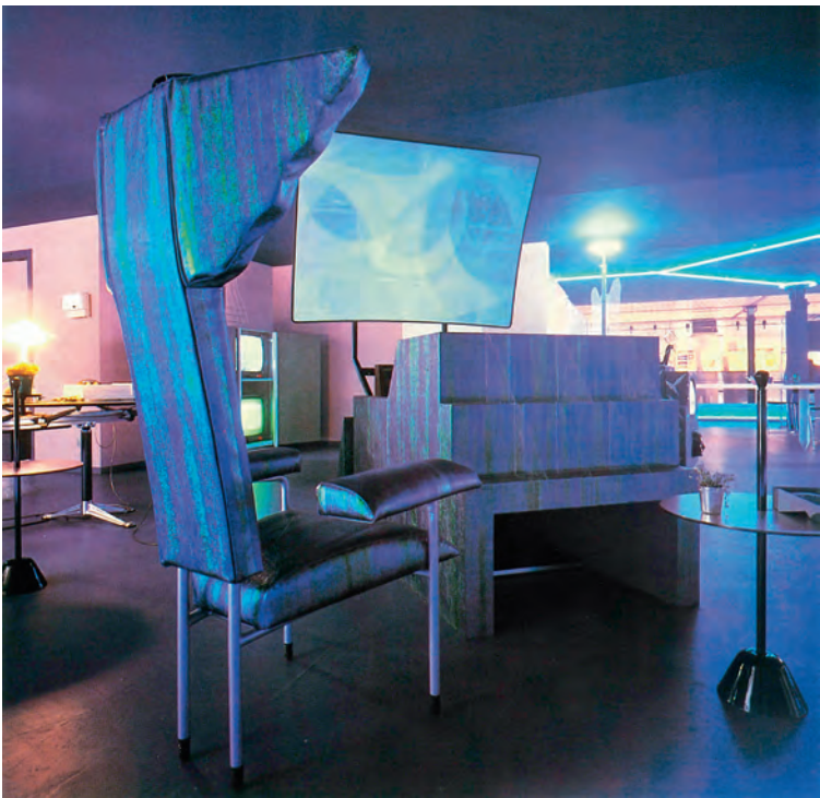
Leunstoel met projector Armchair with projector