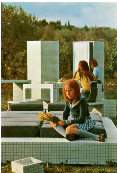
Misura-meubelen, zoals afgebeeld in Domus , nr. 517, december 1972 Misura furniture as depicted in Domus , no. 517, December 1972