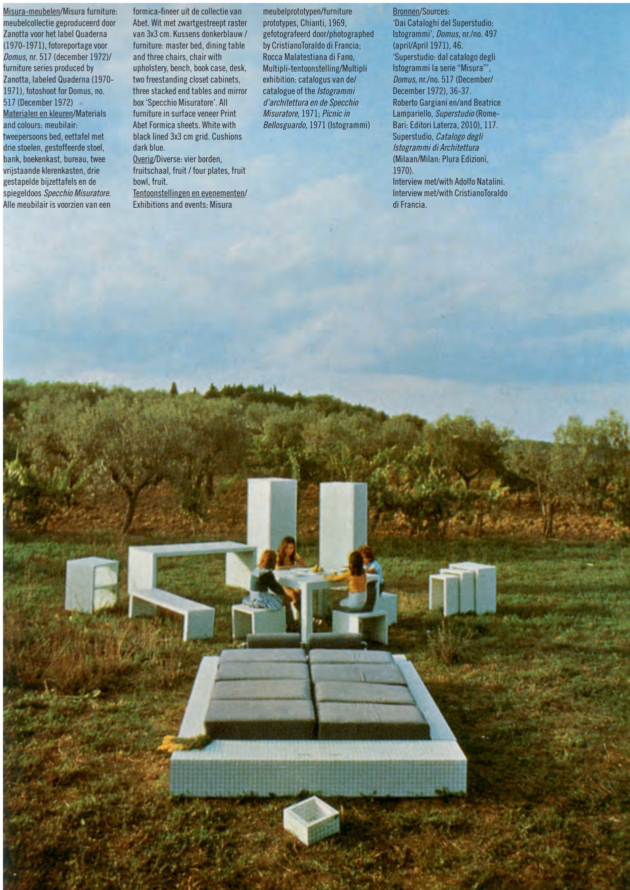
Misura-meubelen zoals afgebeeld in Domus 517, 1972

Interview met/with Adolfo Natalini. Interview met/with Cristiano Toraldo di Francia.