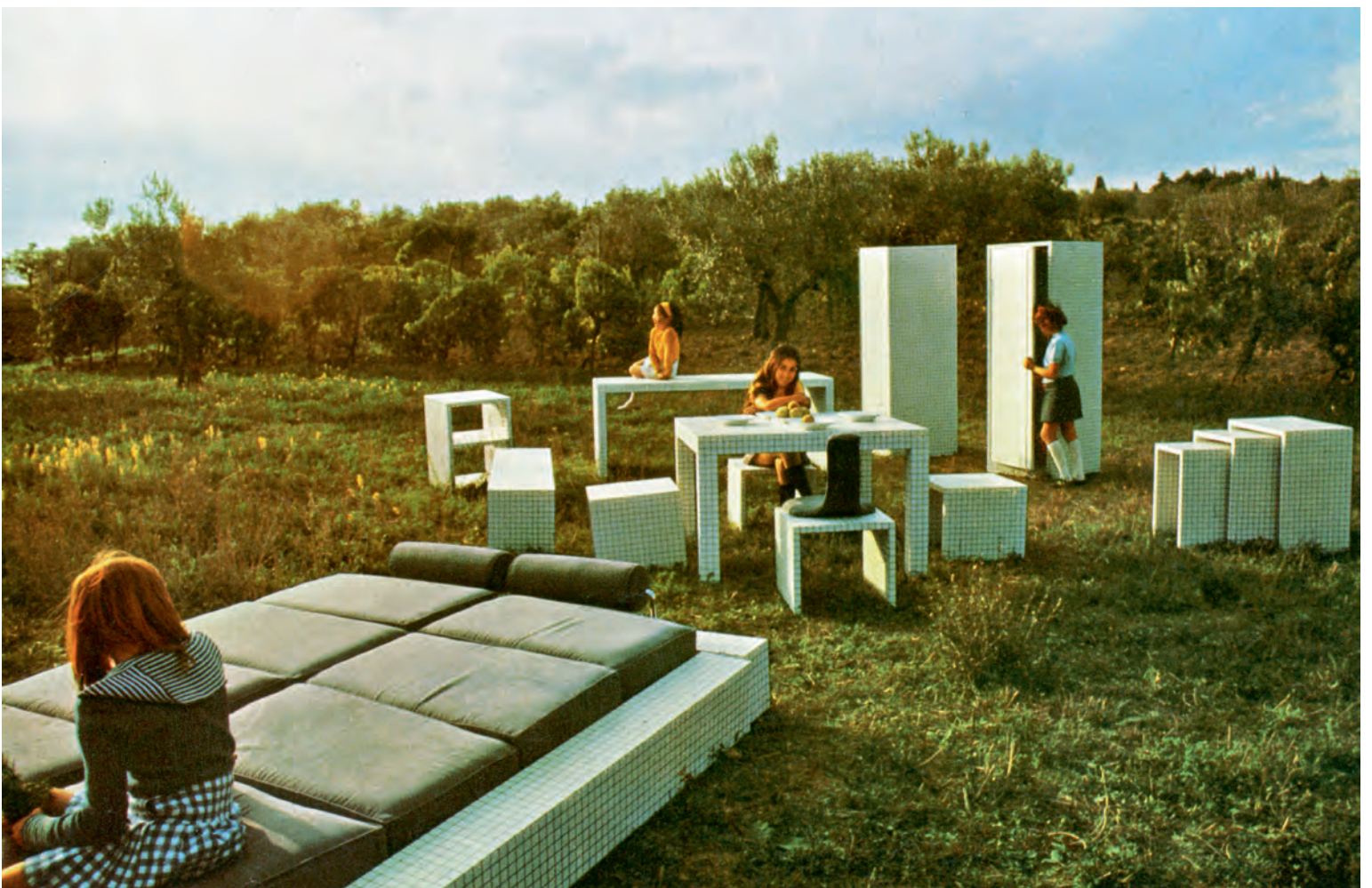
Misura-meubelen, zoals afgebeeld in Domus , nr. 517, december 1972 Misura furniture as depicted in Domus , no. 517, December 1972