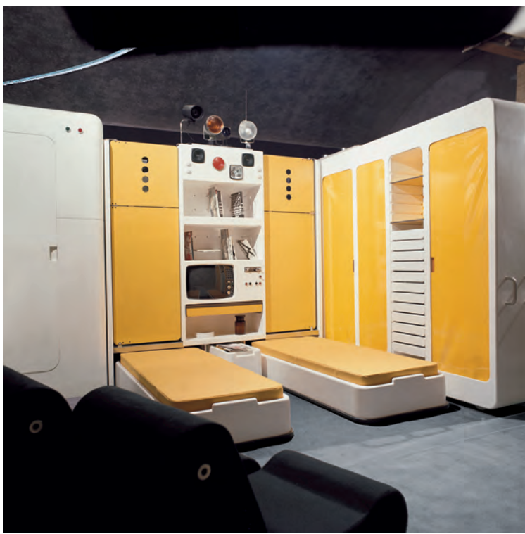
Voorzijde met uitgeschoven bedden en kastelement Front side with extended beds and wardrobe element