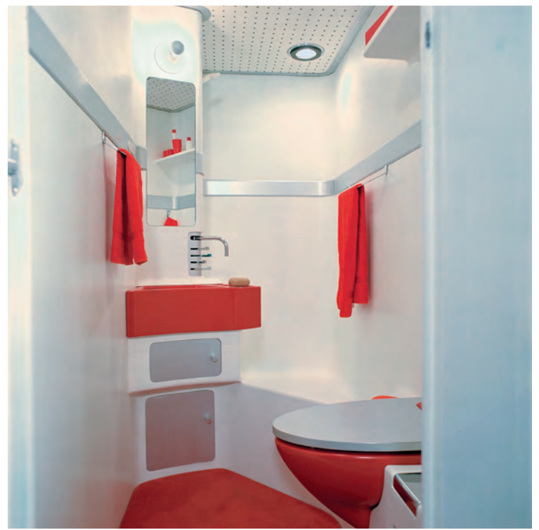
Interieur badkamer Bathroom interior