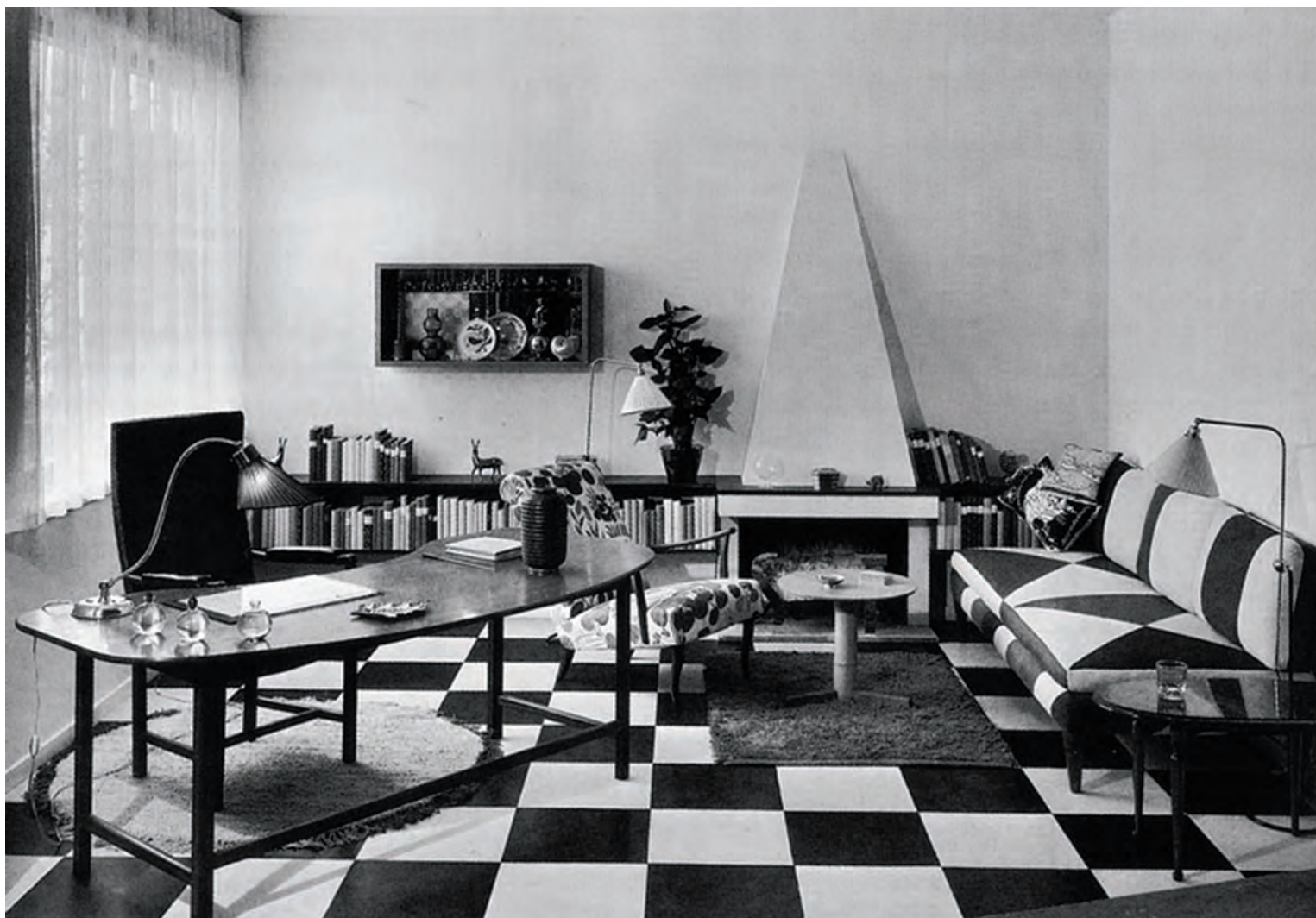
Svenskt Tenn expositieruimte, opstelling in Zweeds paviljoen, wereldtentoonstelling New York, 1939