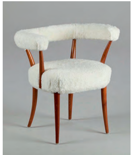
Svenskt Tenn 966 leunstoel Svenskt Tenn 966 armchair