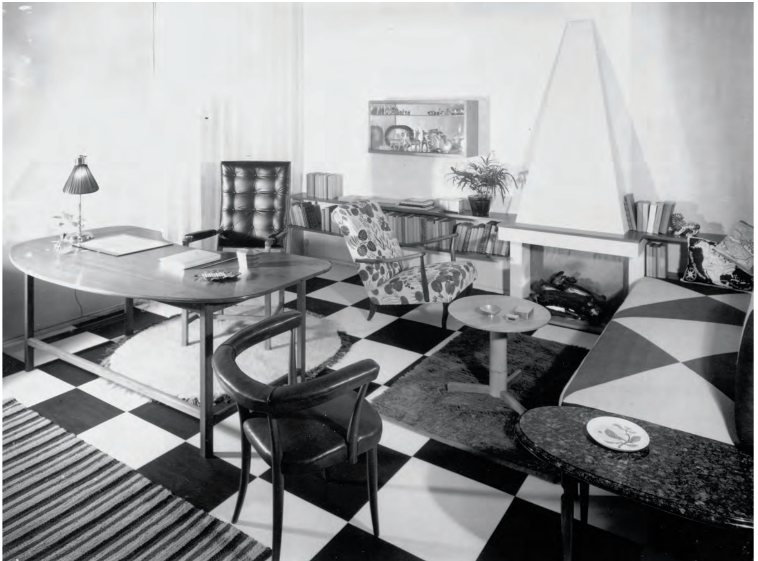
Svenskt Tenn opstelling (studio) zoals tentoongesteld in het Zweeds paviljoen, wereld- tentoonstelling New York, 1939