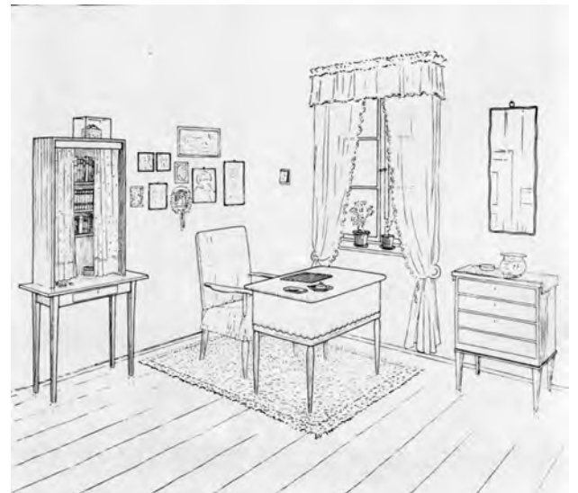
Inrichtingsvoorstel voor rijwoningen in Hohensalza (niet uitgevoerd), 1911 Suggested furnishing for row houses in Hohensalza (not executed), 1911