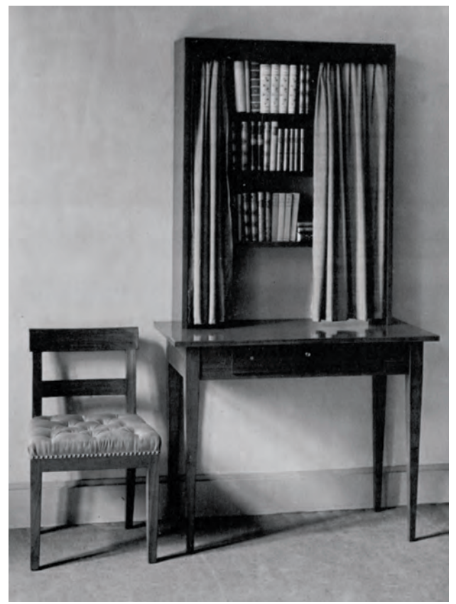
Kleine boekenkast met stoel, ca. 1926 Small bookcase with chair, c. 1926