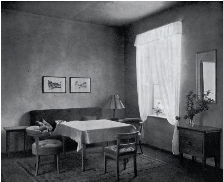
Another arrangement during the 4 th Jahresschau Deutscher Arbeit, 'Wohnung und Siedlung', Dresden, 1925