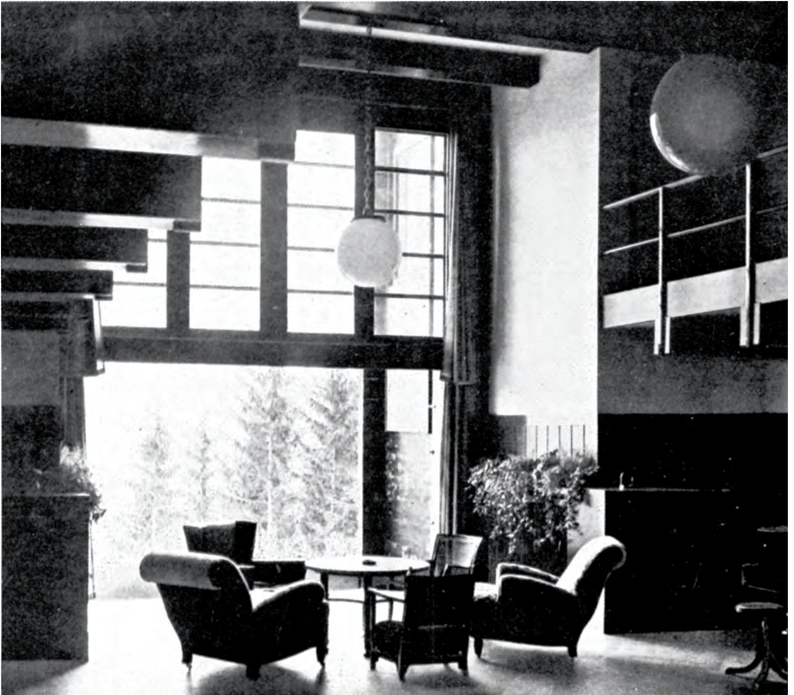
Adolf Loos, woonhal landhuis Khuner, 1930 Adolf Loos, living hall of the Khuner house, 1930

Notities over Hannah Arendt en het private domein Notes on Hannah Arendt and the Private Realm