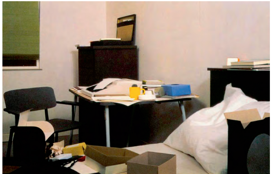
Huiselijkheid als thema in de actuele kunst. Thomas Demand, Zimmer , 1996 Domesticity as a theme in contemporary art. Thomas Demand, Zimmer , 1996