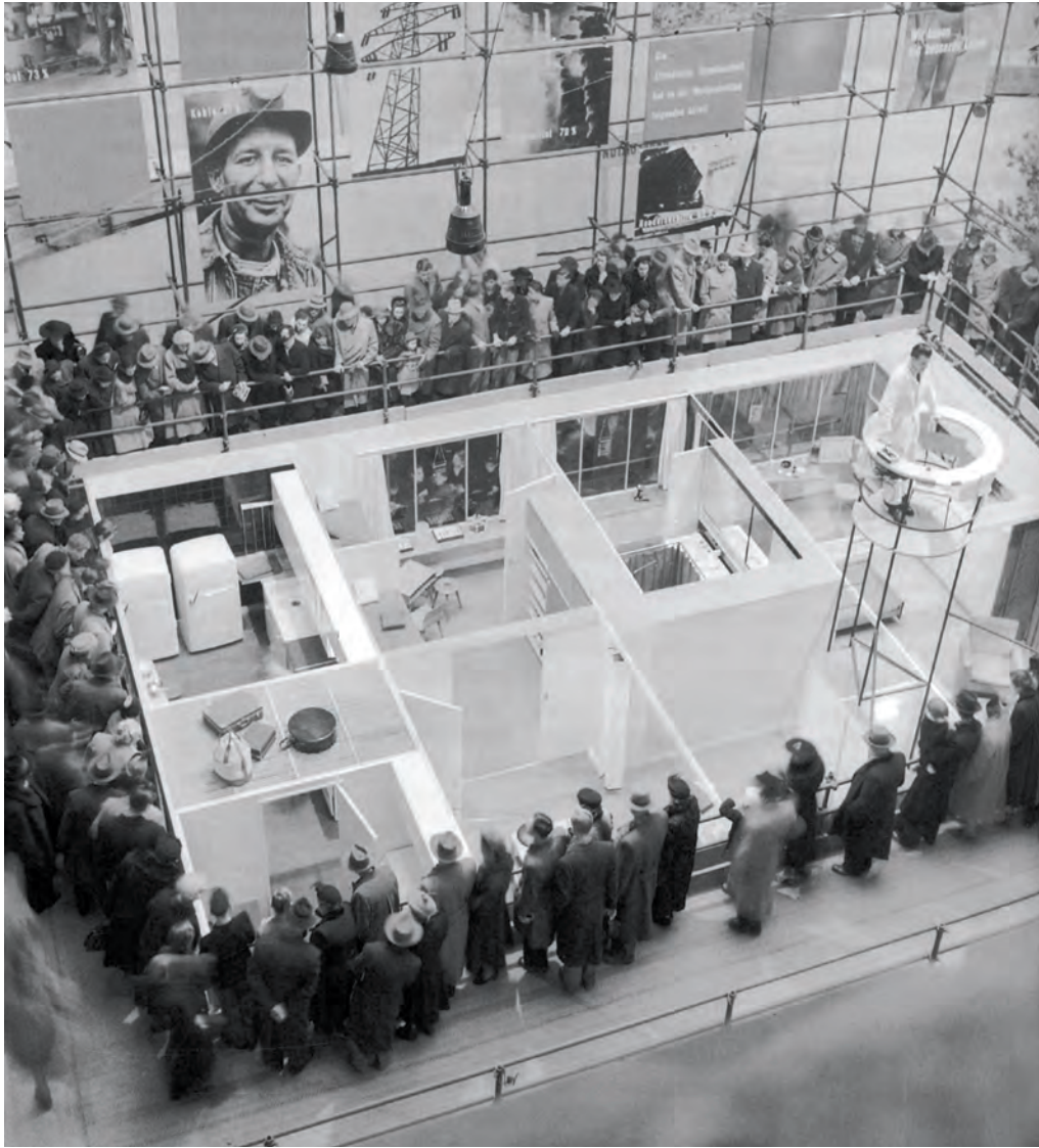
Huiselijkheid als educatief project. Acteurs leren omstanders te wonen in een modern Amerikaans huis. Paviljoen onderdeel van de tentoonstelling 'Wir Bauen ein Besseres Leben, Berlin: Eine Ausstellung über die Produktivität der Atlantischen Gemeinschaft auf dem Gebiet des Wohnbedarfs', in 1952 georganiseerd in Berlijn door The American High Command for Germany.