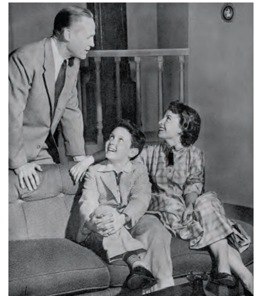
Huiselijkheid publiek gemaakt. Recent, 2014 ( The Bold and the Beautiful ) en in het prille begin van de soapseries, 1956 ( As the World Turns )