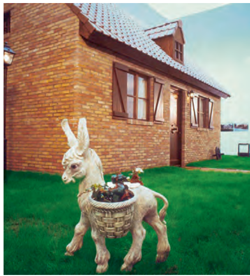
Huiselijkheid als thema in de actuele kunst. Guillaume Van Der Bij, Family Home , 1988 Domesticity as a theme in contemporary art. Guillaume Van Der Bij, Family Home , 1988