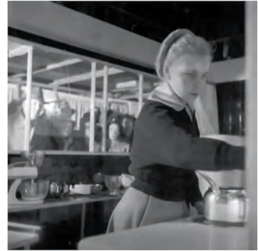
Domesticity as an educational project. Actors teach bystanders about dwelling in a modern American home. The pavilion was part of the exhibition 'Wir Bauen ein Besseres Leben, Berlin: Eine Ausstellung über die Produktivität der Atlantischen Gemeinschaft auf dem Gebiet des Wohnbedarfs', organized in Berlin in 1952 by the American High Command for Germany.