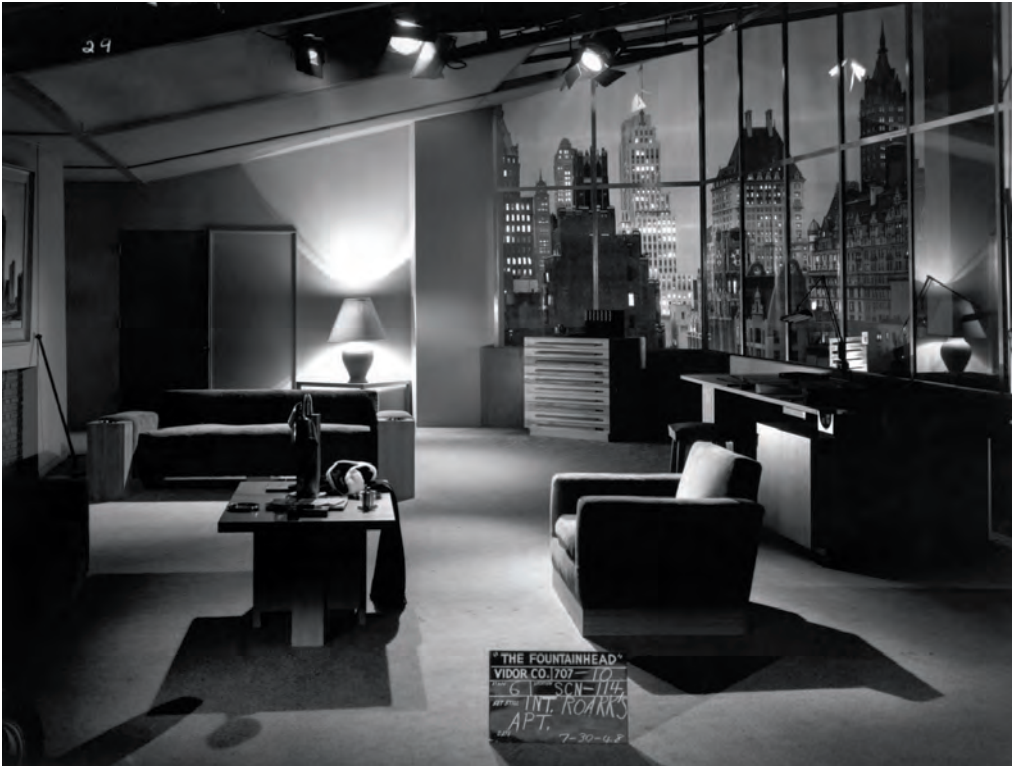
Filmset van de verfilming van The Fountainhead , interieur van Howard Roark's appartement, 1957

Film set of the adaptation of 'The Fountainhead' , interior of Howard Roark's apartment, 1957