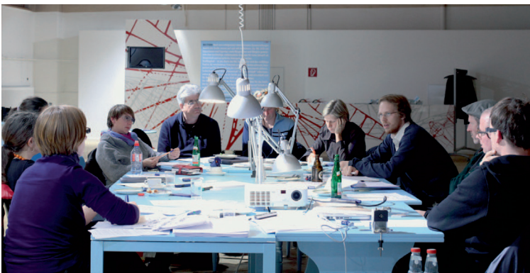
IBA-studio, een openbare werk- en discussieruimte IBA-studio, an open space for work and discussion