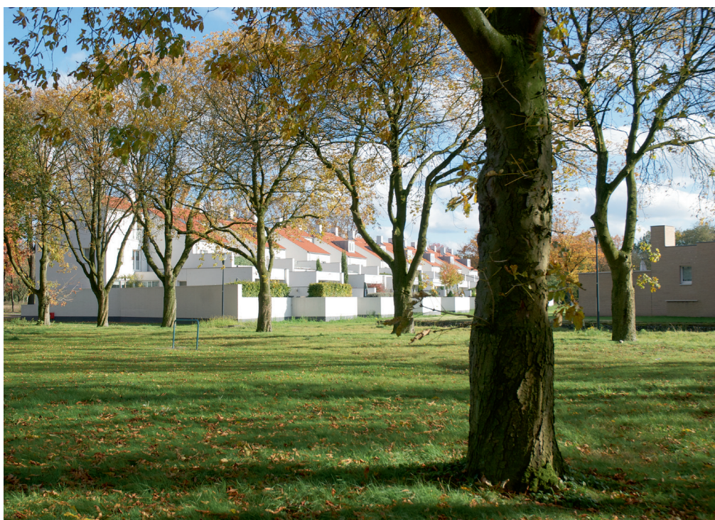
Open groene ruimte hoek Sliffertsestraat/Bosfazant Open green space at corner of Sliffertsestraat/Bosfazant