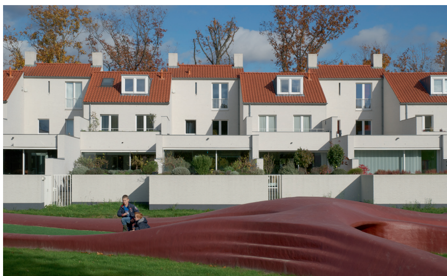
Achterzijde woningen Sliffertsestraat Rear side of Sliffertsestraat dwellings