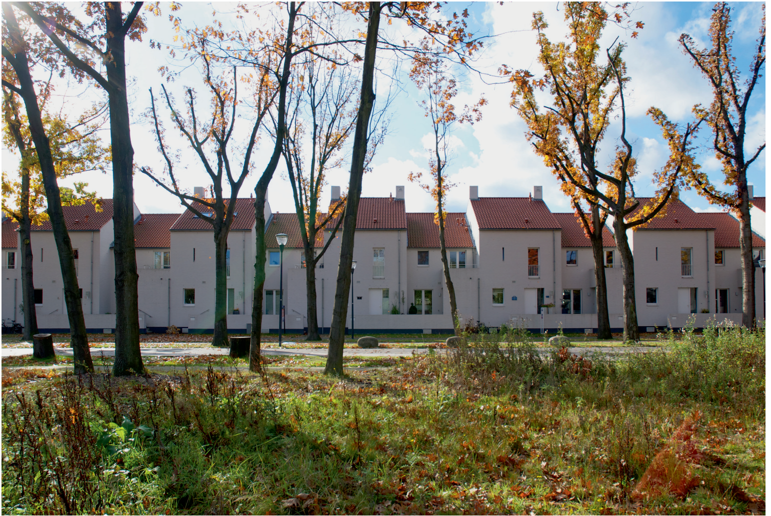
Woningen Sliffertsestraat Sliffertsestraat dwellings

Jos. Bedaux - architect (1910-1989) (Rotterdam: Stichting Bonas, 2010)