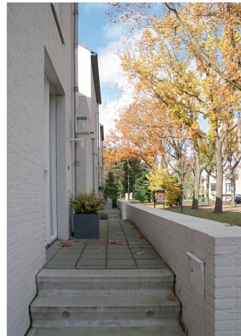
Woningen Bosfazant Dwellings facing Bosfazant