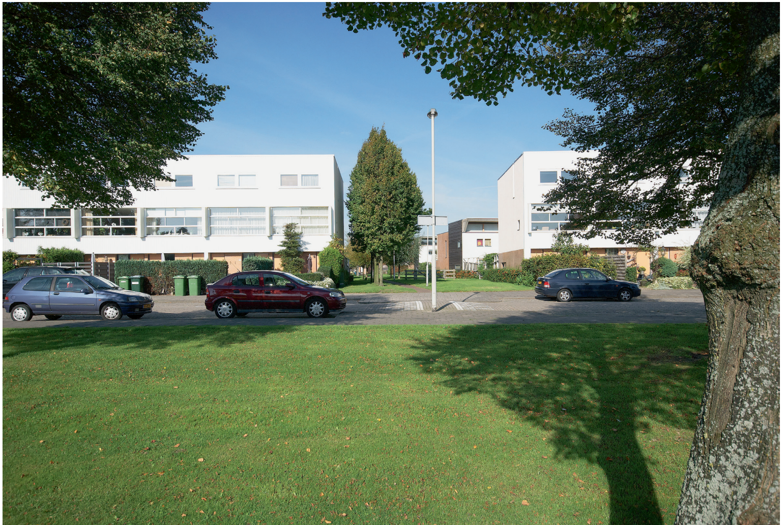
Drielaagse woningen, Clazina Kouwenbergzoom Three-storey dwellings, Clazina Kouwenbergzoom

Bronnen/Sources : Kees Somer, Mecanoo (Rotterdam: Uitgeverij 010, 1995) R. Brouwers (red./eds), Architectuur in Nederland, Jaarboek 1993-1994 (Rotterdam: NAI Uitgevers, 1994)