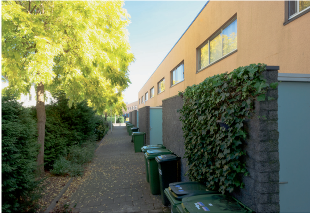
Entreezijde woonpadwoningen Entrance side of the dwellings along the residential paths