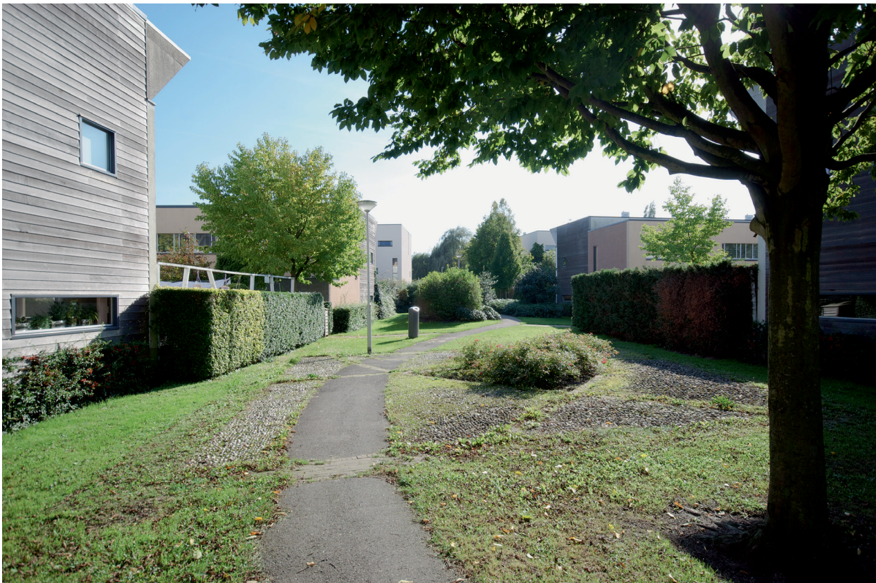
Engelse tuin English garden