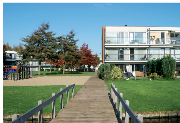
Engelse tuin English garden