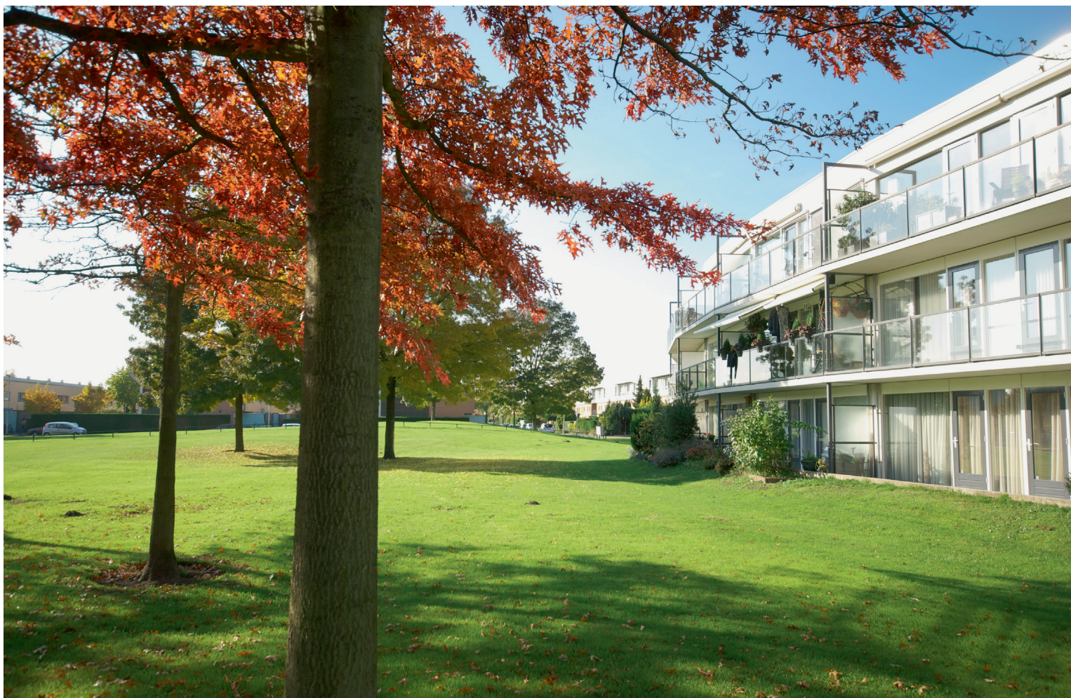
Park Koenraad Bothstraat