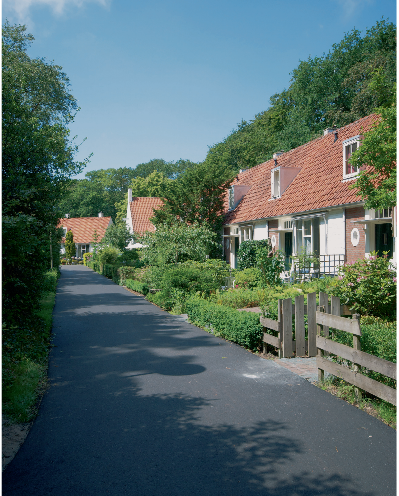
Woonpad Merelhof richting pleintje Merelhof residential path, towards the plaza

Bronnen /Sources: Bouwkundig Weekblad (1950), 369-376 Woorden en Werken van Prof. Ir. Granpré Molière (Heemstede: Uitgeverij De Toorts, 1949)