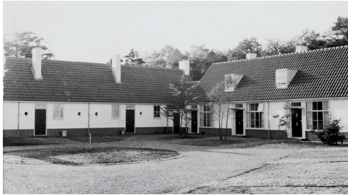
Foto's na voltooiing, ca. 1950 Photos after realisation, ca. 1950