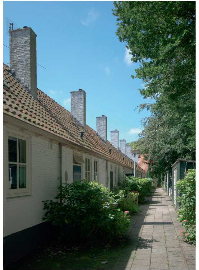
Achterzijde woningen Rear of dwellings