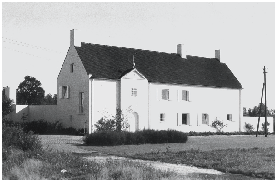
Jos. Bedaux, woonhuis Milders, Turnhout (België), 1962 Jos. Bedaux, private house Milders, Turnhout (Belgium), 1962