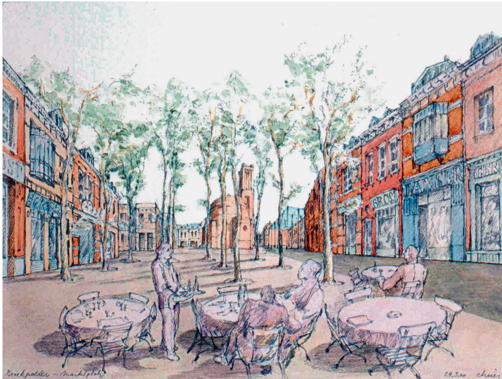
Impressie van de marktplaats Impression of the marketplace