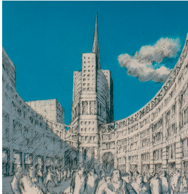
De Resident, Den Haag/The Hague